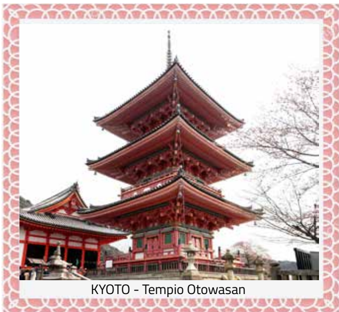
KYOTO - Tempio Otowasan

Iniziamo con il tempio Kiyomizu. Con Kiyomizu o Kiyomizudera ci si riferisce a una serie di templi buddhisti giapponesi, ma in particolare al tempio di Otowasan Kiyomizudera nella città di Kyoto.