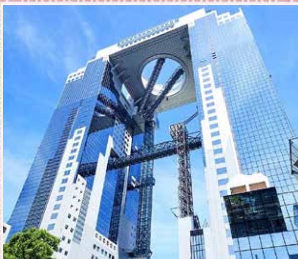
OSAKA - Umeda Sky Building

Partenza con nostro bus privato alla volta di Osaka. Dopo circa un'ora arriviamo al Castello di Osaka. Situato nella città di Osaka, è uno dei più famosi e storici castelli in tutto il Giappone. Fu originariamente costruito nel 1583 dal leggendario Daimyo Toyotomi Hideyoshi come simbolo del potere del suo clan nelle province centro-occidentali del Paese. La sua torre principale di sei piani ha un'altezza di circa 50 metri ed è un'opera d'arte architettonica e culturale.