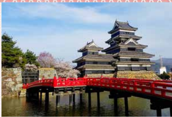
MATSUMOTO - Castello

Proseguiamo sempre in pullman per arrivare a Matsumoto (40 km), sede di uno dei siti più suggestivi e tesoro nazionale. Il Castello di Matsumoto è uno dei più grandi del Giappone. La sua torre principale di cinque piani, costruita alla fine del XVI secolo, è la più antica torre del castello a essere sopravvissuta nella nazione.