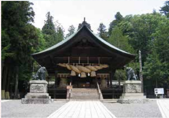
SUWA - Santuario Suwa Taisha

Secondo il Kojiki, la raccolta più antica di storie, tradizioni e leggende giapponesi (creata nel 712), il Santuario Suwa Taisha affonda le sue origini in un evento noto come kuni-yuzuri, durante il quale la sovranità del Giappone passò dagli dèi del paradiso agli dèi della terra.