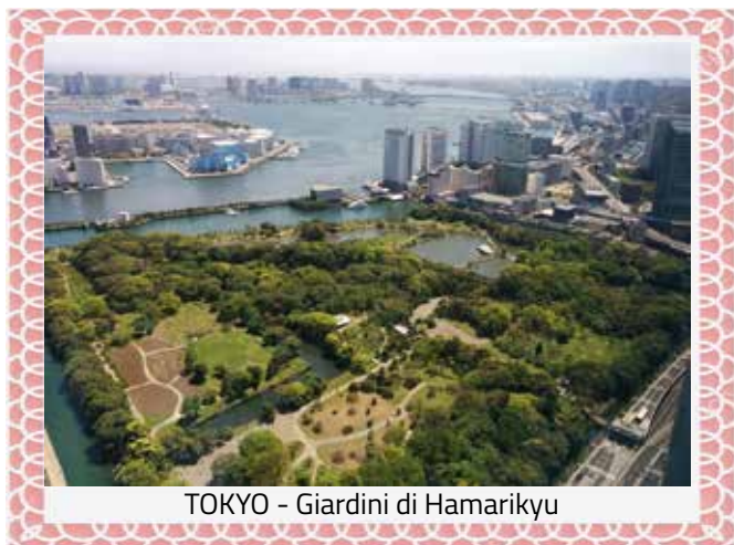
TOKYO - Giardini di Hamarikyu

Arrivo all'aeroporto Haneda di Tokyo. Disbrigo delle formalità doganali e incontro con la guida locale parlante italiano. Trasferimento in direzione del nostro hotel. Passando per il centro della città ci fermiamo ai giardini di Hamarikyu per poi pranzare in un ristorante locale vicino al famoso mercato di Tsukiji.