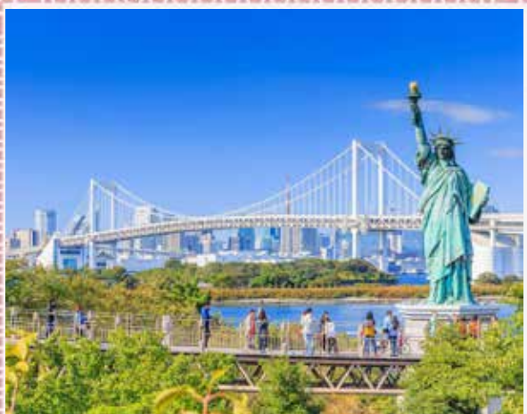
TOKYO - Odaiba

Dopo pranzo iniziamo a scoprire la Tokyo moderna. Iniziamo con il quartiere di Odaiba realizzato sull'omonima isola artificiale nella Baia di Tokyo, collegata alla città tramite il Rainbow Bridge. Nel 1996 vennero inaugurati l'avveniristica nuova sede della Fuji Tv, l'altrettanto avveniristico Telecom Center, il centro fieristico Tokyo Big Sight, e Decks Tokyo Beach, il primo di una lunga serie di grandi centri commerciali che verranno aperti sull'isola. Odaiba è oggi una delle zone più interessanti della città, con una ruota panoramica, diversi musei, alcuni hotel, un grande centro termale, una Statua della Libertà e un Gundam gigante.