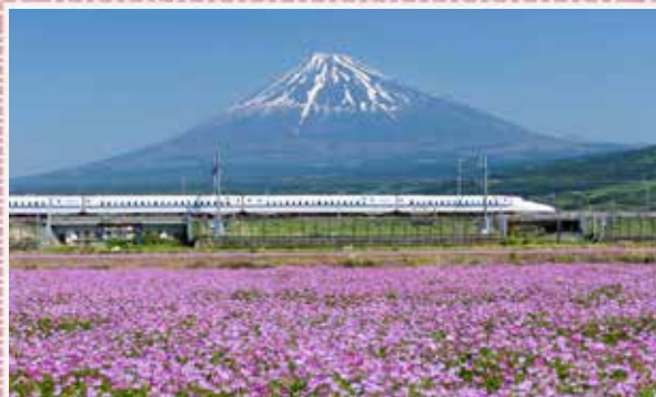
Super Express Shinkansen

Dopo la colazione trasferimento alla stazione dei treni e partenza con treno Super Express Shinkansen. Arrivo dopo circa 2 ore e mezza di viaggio (500 km) a Tokyo.