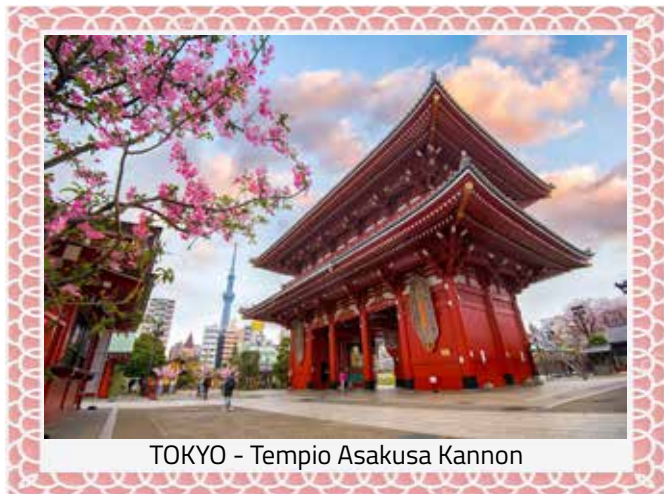
TOKYO - Tempio Asakusa Kannon

Dopo la colazione incontro con la guida e inizio delle visite con il nostro pullman. Prima tappa è il tempio di Meiji, santuario shintoista dedicato agli spiriti divinizzati dell'imperatore Meiji e di sua moglie Shoken. Ci spostiamo nei 2 quartieri della "street art" con gli stravaganti negozi di moda, Harajuku e Omotesando, dove poi pranzeremo.